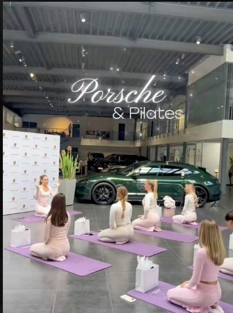
Un événement Sur-Mesure PORSCHE x PILATES